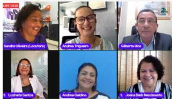
5 - Participação no programa na radio mulher na cidade do Cabo de Santo Agostinho falando sobre os conselhos da criança, adolescência e Idoso. Falamos também sobre destinação de imposto de renda para os fundos municipais