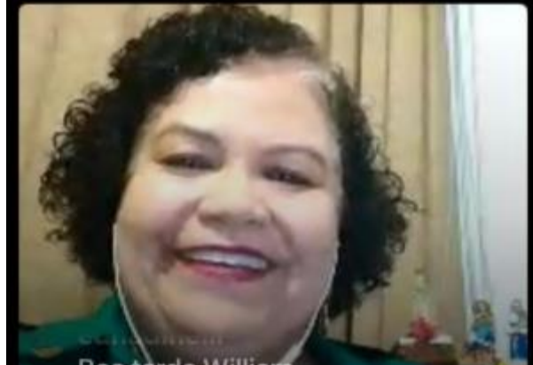
4 - Participação em uma live falando sobre destinação de imposto de renda convidada pelo CRC/AM