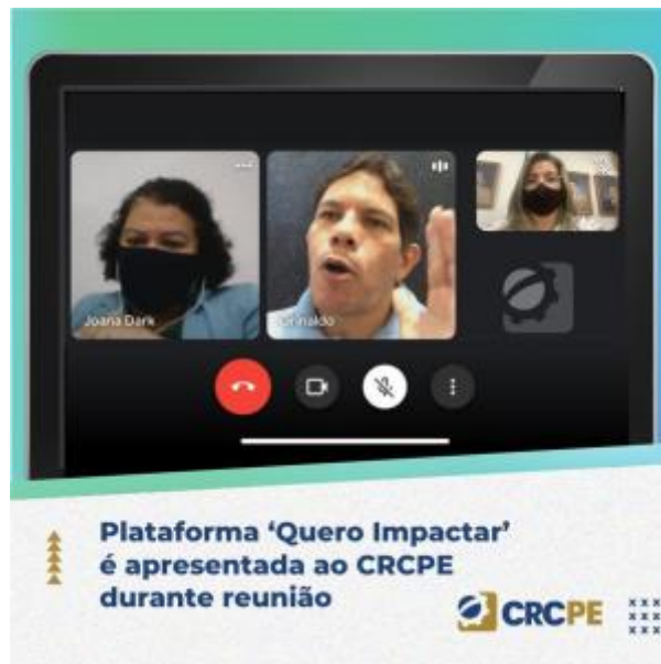
7 - Reunião com o coordenador da Plataforma Quero Impactar da Prefeitura do Recife para firmar parceria com o CRCPE através do PVCC/PE para participação da comissão da Plataforma que trabalha as ações de destinação de imposto de renda em projetos aprovados no Conselho Municipal da Criança e Idoso.