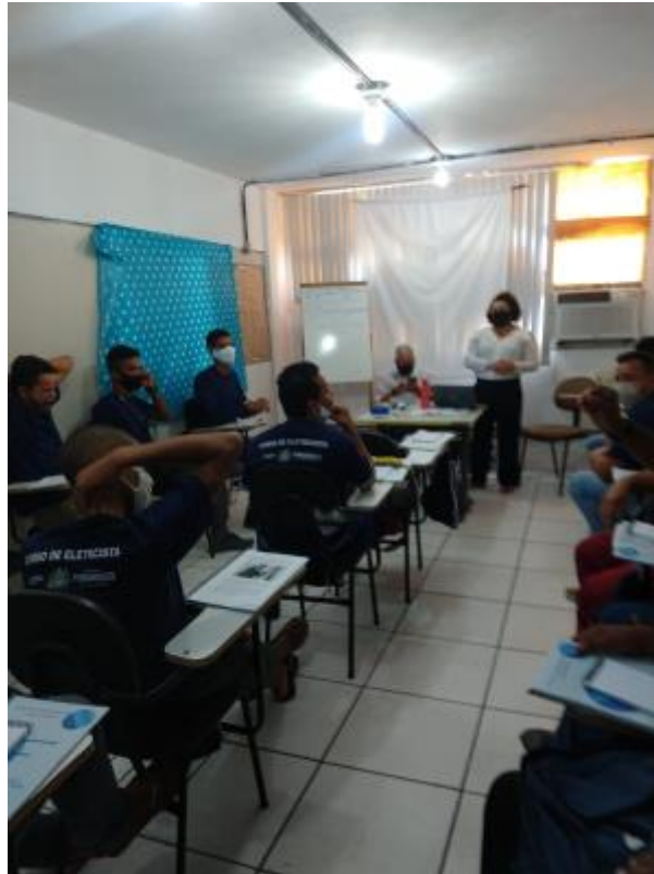
3 - PALESTRA SOBRE FORMALIZAÇÃO DE NATUREZA JURIDICA MEI