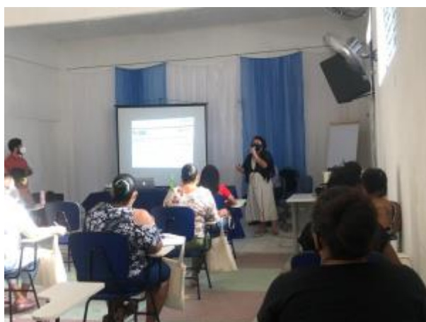
2 - Palestra sobre formalização natureza jurídica MEI para uma turma de Mulheres empreendedoras da comunidade caranguejo em Recife/PE